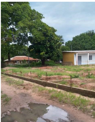
Wateroverlast zorgt voor vertraging